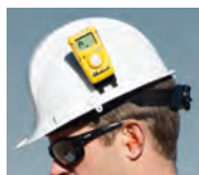
Clip für Schutzhelm