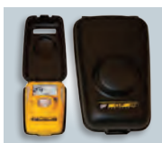
Gehäuse für Ruhezustand