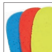
HAIX® Vario Wide Fit System