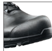
HAIX® Composite Schutzkappe