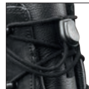
HAIX® Smart Lacing