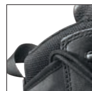
HAIX® Climate System